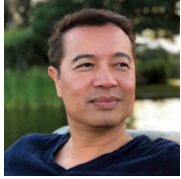
Samedi SATH ACSED IDF